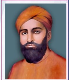
Sadhu Sundar Singh

மேலும் கிருத மாதத்தில், பரி. மத்தேயுவின் திருநாளை ஆசரிக்க கிருக்கிறோம். நாமும் அவர் போல சுயத்தை விடுத்து, எல்லாவற்றையும் விட்டு, கியேசுவை பின் தொடர் தேவன் கிருபை செய்வாராக! கிம்மாதம் 13, 14, 15 ஆம் தேதிகளில் தூய மத்தேயு திருநாளை முன்னிட்டு நடைபெறும் கன்வென்ஷன் கூட்டல்களில் யாவரும் உற்சாகமாக பங்குபெறுமாறு அன்புடன் கேட்டுக்கொள்கிறேன்!