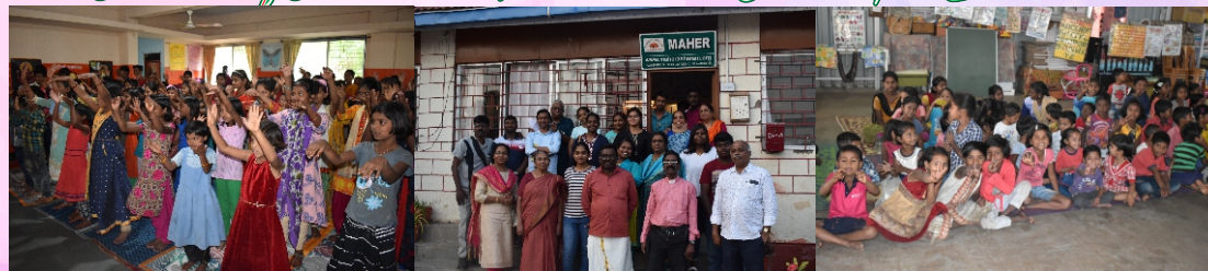
MAHER-KENDUR 30 th NOV 2019